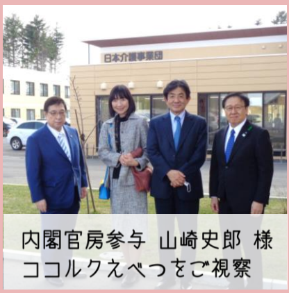
内閣官房参与 山崎史郎様 ココルクえべつをご視察

12日開催の多世代交流サロン『CoCoカフェ』は、地域の方に加えサ高住「ゆうゆうじてき」江別の入居者様や「あさのわ保育園」の園児たちが遊びに来てくれ、いつも以上に多世代の交流を感じられる回となりました！