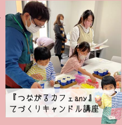
『つながるカフェany』 てづくりキャンドル講座