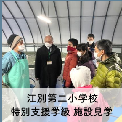
江別第二小学校 特別支援学級 施設見学

養殖場では、初めてのふぐに大盛り上がり！真剣に話を聞きながらも、わくわく見学を楽しむみなさんでした。▼