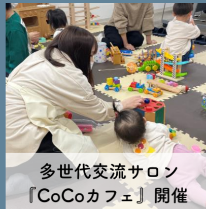
多世代交流サロン 『CoCoカフェ』開催

13日、年内最後の多世代交流サロン『CoCoカフェ』を開催しました。クリスマスに向け、折り紙でミニツリーなどを制作。参加された方の「来年も来ます」という声に、スタッフ同ほっこりしていました。▼