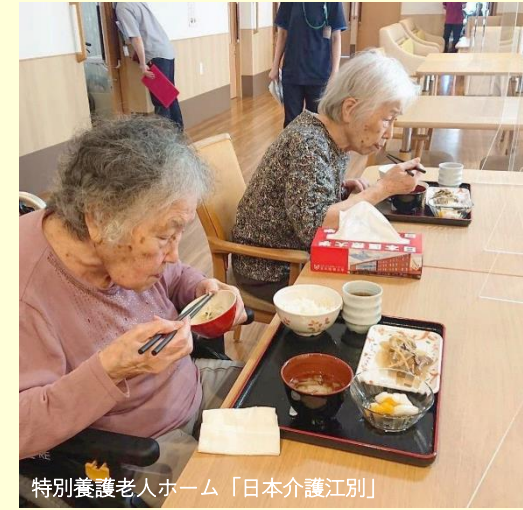
特別養護老人ホーム「日本介護江別」