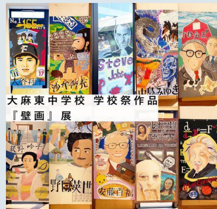
大麻東中学校 学校祭作品